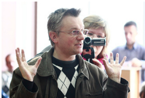
Детальний фотозвіт з Загальних зборів ГО «Поступ» дивіться на сторінці ПОСТУП в мережі Facebook