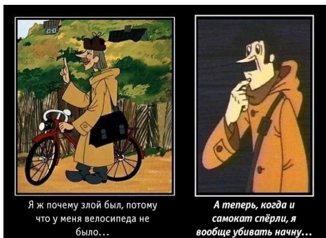
Я ж почему злой был, потому что у меня велосипеда не было...